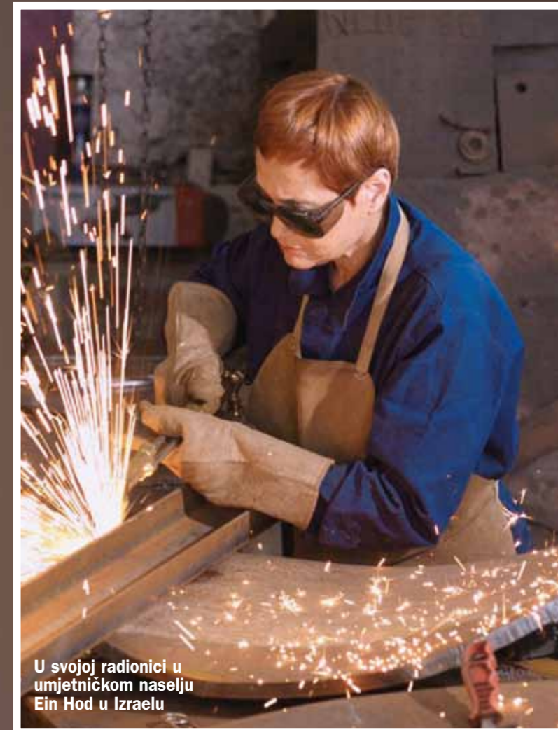
U svojoj radionici u umjetničkom naselju Ein Hod u Izraelu

Izložbom Ptice u letu u zagrebačkoj Gliptoteci izraelska umjetnica napravila je puni krug: svoje divovske željezne skulpture, kakve krasi javne prostore od Kanade i SAD-a do Kine, donirat će rodnim Vinkovcima, gdje su se do Drugog svjetskog rata tri generacije njene obitelji Gross bavile - željezom